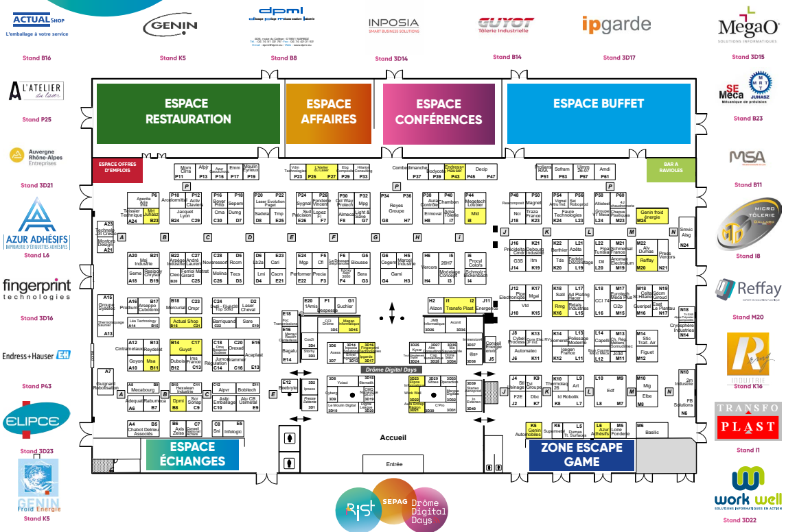
(Plan du salon février 2020)

Exemple : Fiche exposant avec logo + 3 photos